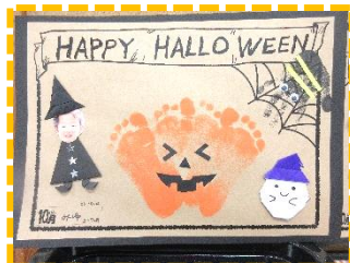
10月の制作 (ハロウィン)