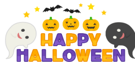
英語で遊ぼう (ハロウィン)