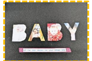
ママの製作教室 (ロゴフォトフレーム)