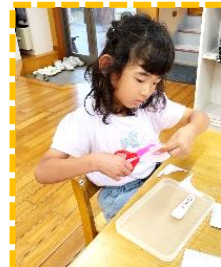
モンテッソーリ (ハサミ)