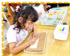
モンテッソーリ (縫いさし)